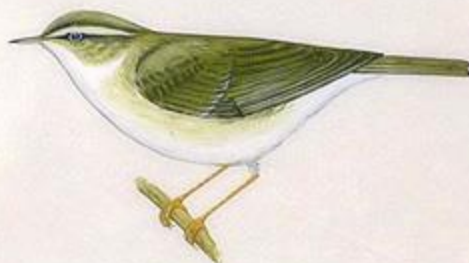
センダイムシクイ