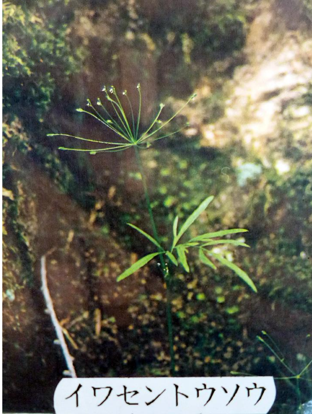
イワセントウソウ