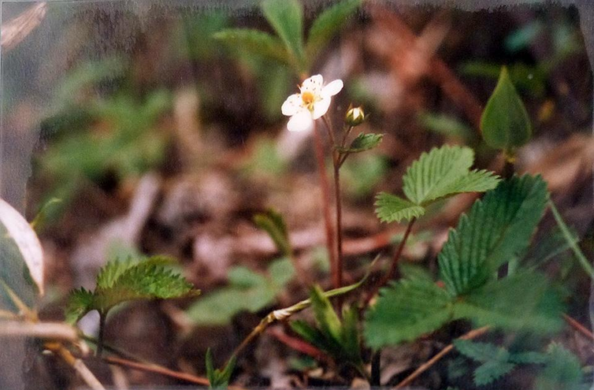
シロバナノヘビイチゴ