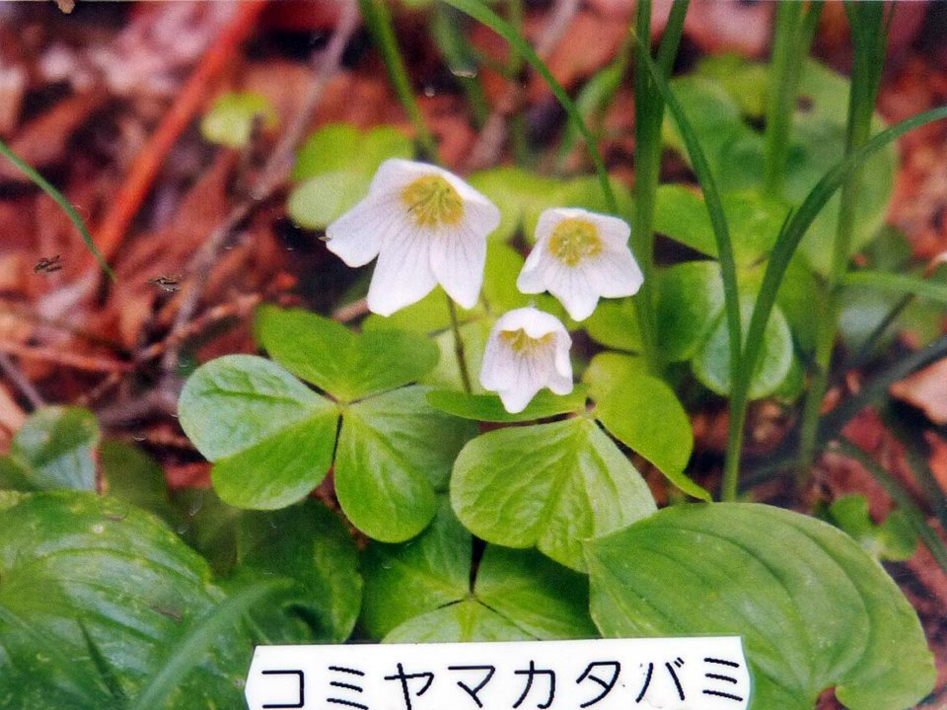
コミヤマカタバミ