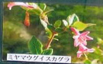
ミヤマウグイスカグラ