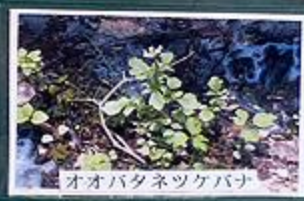
オオバクネツクバナ