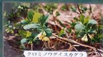
クロミノウグイスカグラ