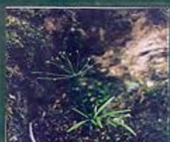
イワセントウソウ