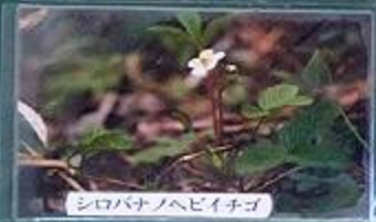
シロバナノヘビイチゴ