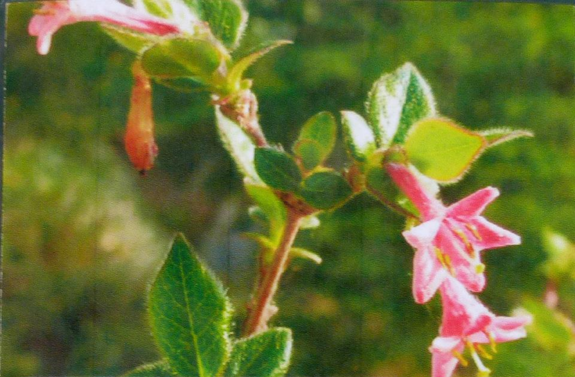
ミヤマウグイスカグラ