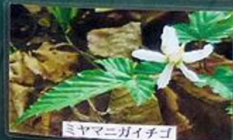
ミヤマニガイチゴ