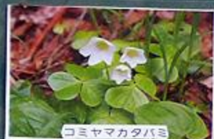
コミヤマカタバミ