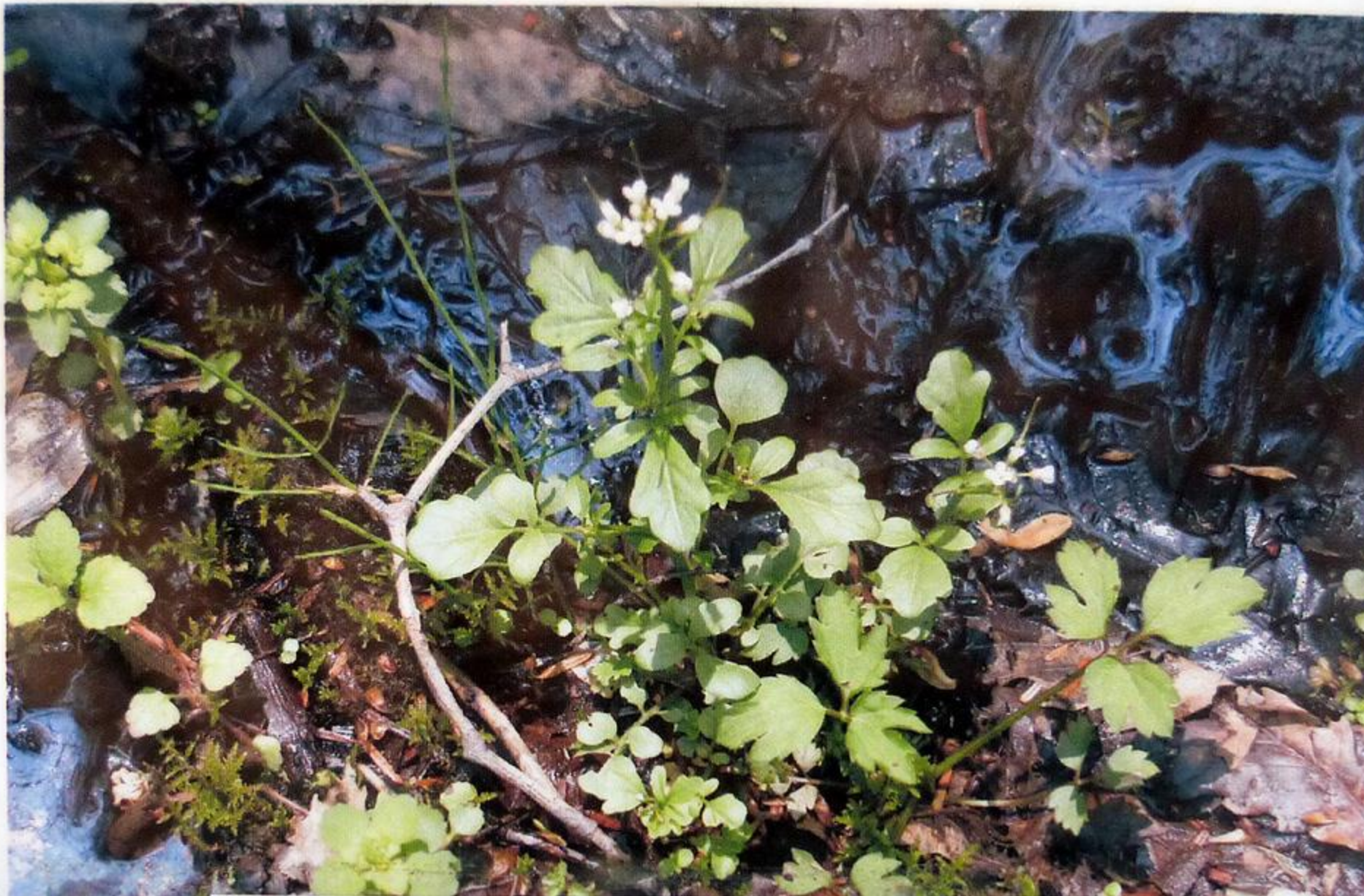
オオバタネツケバナ