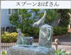
スプーンおばさん