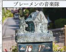
ブレーメンの音楽隊