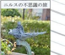
ニルスの不思議の旅