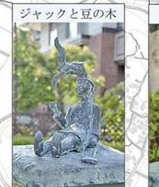
ジャックと豆の木