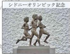
シドニーオリンピック記念