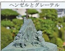
ヘンゼルとグレーテル