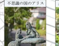
不思議の国のアリス