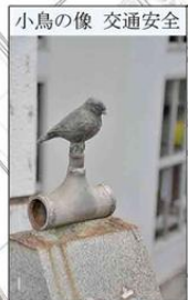
小鳥の像 交通安全