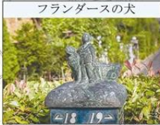
フランダースの犬