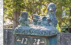
みにくいあひるの子

作者 淀井 敏夫 (よどい としお) 1911年2月15日～2005年2月14日 削げたような形態と岩のような質感のユニークな作品で知られる。文化勲章受章。個人美術館としてはあさご芸術の森美術館、淀井敏夫記念館がある。