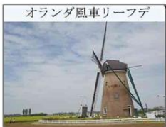
オランダ風車リーフデ