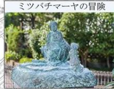
ミツパチマアヤの冒険